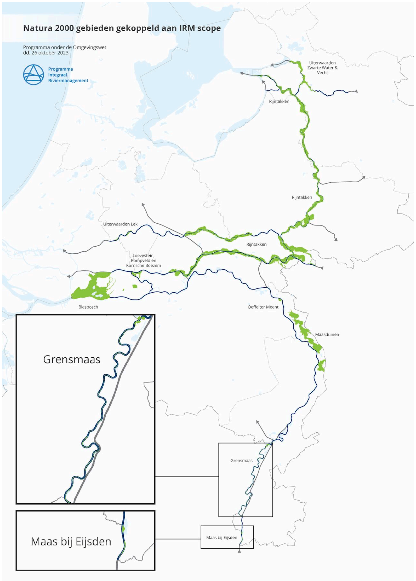
Figuur 3-1 Ligging Natura 2000-gebieden binnen IRM