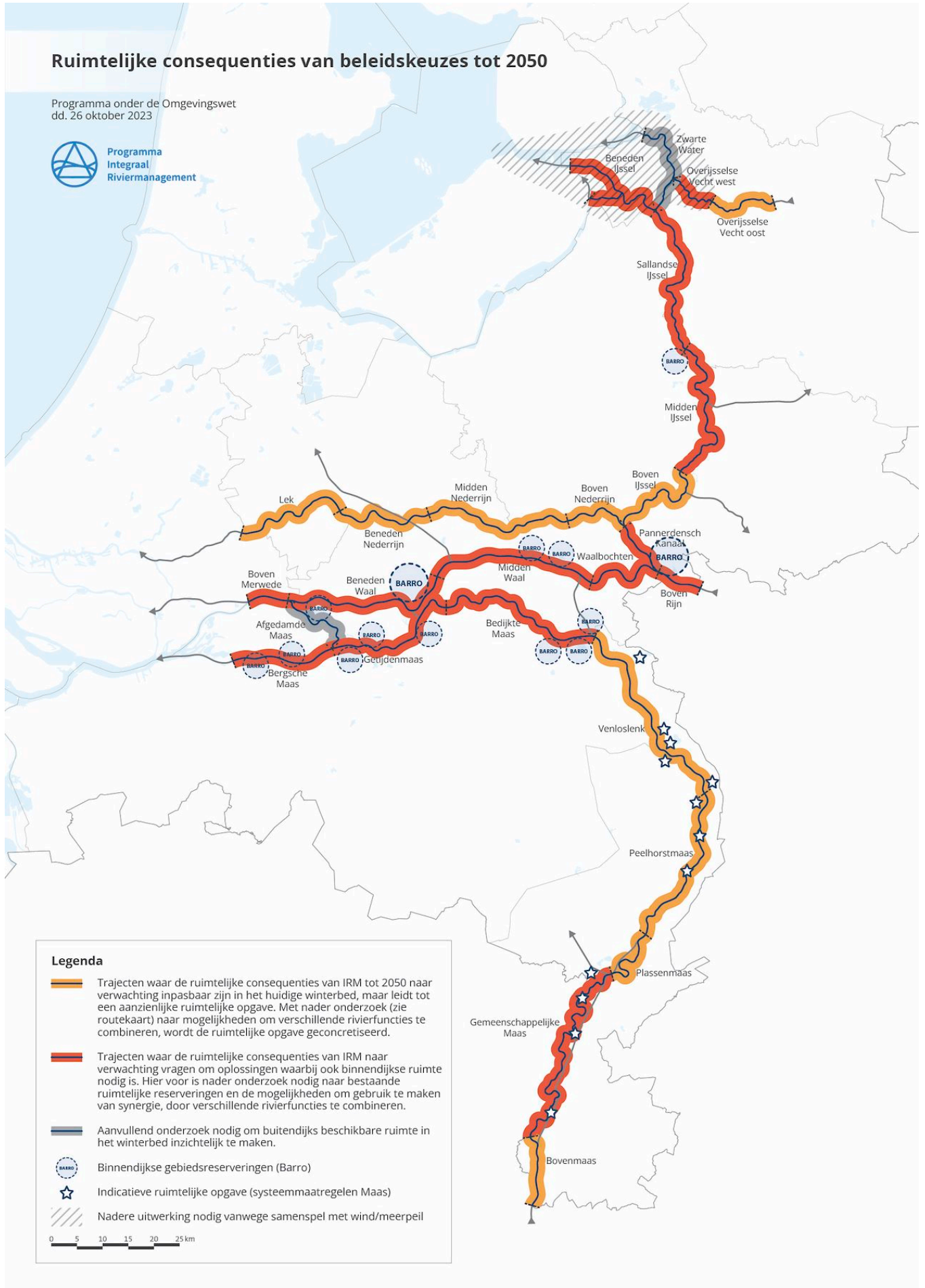
Figuur 4-3 Beschikbaar areaal voor rivierverruiming tbv afvoercapaciteit